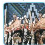
Haka (ハカ) New Zealand