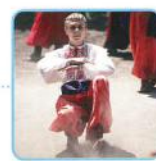
Cossack dance (コサックダンス) the Ukraine