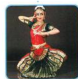
Bharatanatyam (バラタナティヤム) India