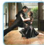
Tango (タンゴ) Argentina

How many dances do you know? Let's find other dances in the world!