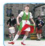
Irish dance (アイリッシュダンス) Ireland

What kind of dances are there around the world?