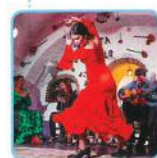
Flamenco (フラメンコ) Spain