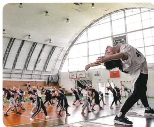
2015年、チェコでのワークショップ

After graduating from high school, I went to Los Angeles. I really felt free there and learned how to express myself naturally. I realized that I can show my personality through dancing.